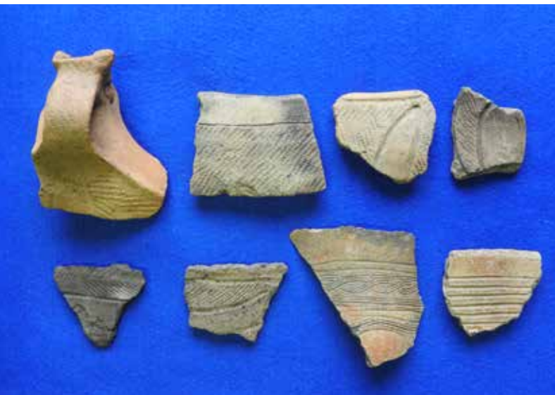
雁石遺跡出土土器（縄文中～晩期）