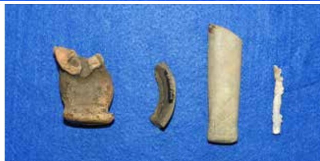
雁石遺跡出土遺物（土製品・石製品など）