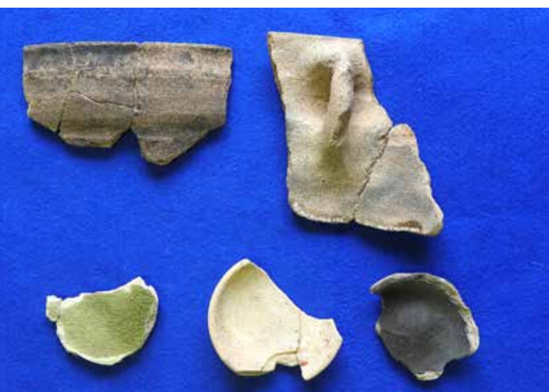
岩門城出土土器（内耳鍋、かわらけなど）