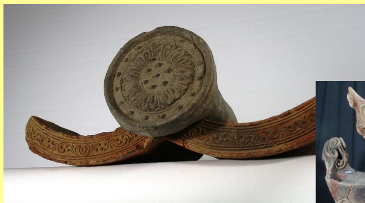
信濃国分寺資料館展示資料

* 信濃国分寺資料館ホームページの「イベント情報」にも申込フォームのリンク先があります。